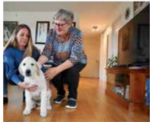
En liten hvalp, ble adoptert av en jente. Det var veldig spesielt. Etter hverdagen til barna for å hjelpe dem med å bli bedre.